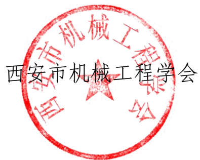
西安市机械工程学会