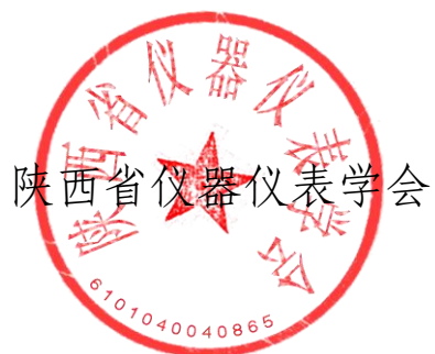
陕西省仪器仪表学会