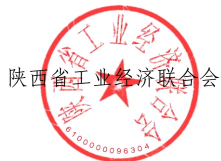
陕西省工业经济联合会