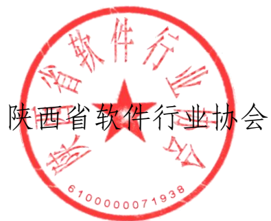
陕西省软件行业协会